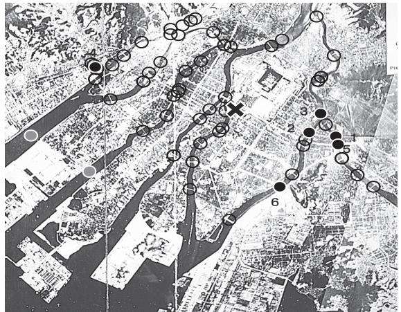
被爆前にあった59橋(番号は被爆橋梁)

設コンサルタントとして橋の維持管理・長寿命化の仕事について18年とあります。この間、国内外の多くの橋に接し、また被爆橋梁にも関連した仕事を