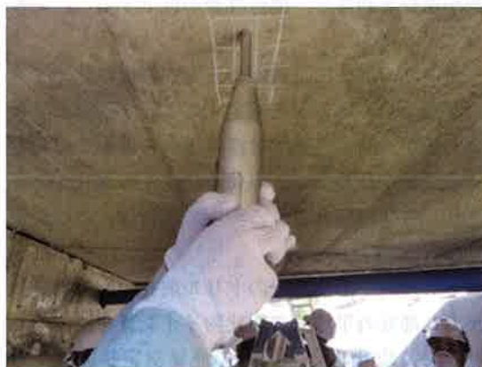
写真-1 リバウンドハンマーによる表面反発度の測定状況