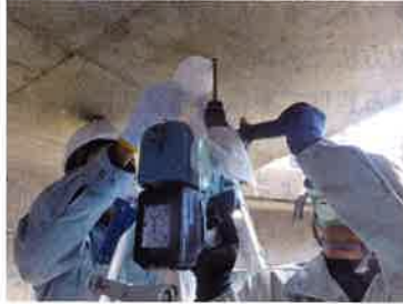
写真-2 ドリル法による中性化測定状況