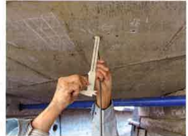
写真-4 中性化深さの計測状況

コンクリートにひび割れが生じる。さらに腐食膨張が進むと剥落し、構造性能が低下することになる。