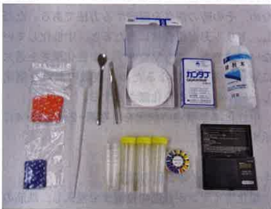
写真-5 塩化物イオン量の簡易測定装置「クロキット」