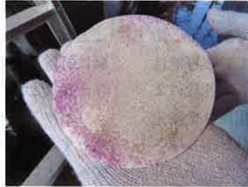
写真-3 中性化していない粉体の呈色