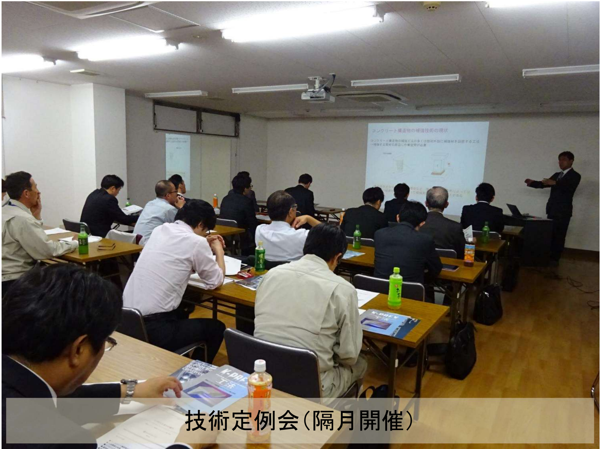
技術定例会(隔月開催)